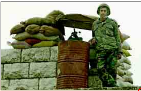
امیل لحدود، رئیس جمهوری لبنان برای گفت و گو درباره خروج نیروهای سوریه به دمشق رفت