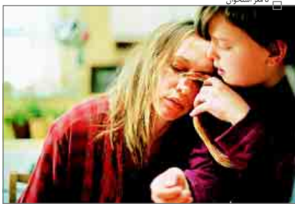
تا مکز استخوان

دیبران ونوسدگان نشریه سینمایی «ایندی وایر» برای هفتمین سال پیلی فهرستی از بهترین فیلم های سال ۲۰۰۴ را سراسر جهان را که در جشنواره ها و رویدادهای سینمایی دیده اند و امکان پخش و نمایش در آمریکا را به دست نیارده اند، معرفی کردند. این خرکت نوعی حمایت از سینمای مستقل و هنری است که به لحاظ اقتصادی توان مقابله با جریان اصلی سینما در آمریکا و امواجش در سراسر دنیا را به دست نمی آورد و فرصتی برای مخاطبان جدی تر سینما تا به شکل های مختلف فرصت تماشای این فیلم ها را به دست آورد. بخصوصی که ایندی وایر برای دومین بار با همکاری مؤسسه فیلم کالیفرنیا تعدادی از فیلم های این فهرست را در مجموعه ای با عنوان «جواهرهای کشف نشده» از اول آوریل جمعه گذشته به مدت هفت روز به نمایش گذاشت. این ۹ فیلم از میان فهرست ۱۵ تایی ایندی وایر انتخاب شدند و روی پرده رفتند. معرفی مجموعه جواهرهای کشف نشده، که ترکیبی از فیلم های داستانی و مستند از کشورهای مختلف هستند، حالی از لطف نیست. این انکار دو مؤسسه آمریکایی که توسط کمیته ای بزرگ کدک حمایت می شود، نشانگر آن است که در عهد هالیوود، توجه به سینمای متفاوت فراموش نمی شود و هر نوع مخاطبی فرصت دسترسی به محصول مطابق با سلیقه اش را پیدا می کند. علی صلح حیدرزاده