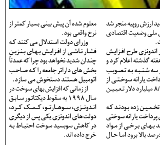
دست کم هشت شهر بزرگ رود.

دومین نمایشگاه بین المللی خودرو «اوتو موتوشو» از روز جمعه لغایت ۲۲ اکتبر (دهم مهرماه) در مرکز نمایشگاهی «اواکسپونستر» تاکنون پایتخت ازبکستان گنایش یافت. در نمایشگاه بین المللی «اوتو موتوشو» ۲۰۰۵ شرکت، ازبکستان، روسیه، آمریکا، آلمان، اسرائیل، لهستان، روسیه، ترکیه، اوکراین، فنلاند و ازبکستان در زمینه، بر اساس این گزارش، در این نمایشگاه انواع خودروهای سنگین از قبیل اتوبوس، خودروهای ویژه، تریلر، کامیون، انواع موتور خودرو و ماشین های ساختمان و راهسازی، انواع دستگاه و سیستم های ضد سرقت، انواع خودرو و وسایل نقلیه آسان، لامپتین خودرو، تجهیزات بیم پزشکی و غیره و به نمایش گذاشته شده است. این گزارش می گوید: نمایشگاه بین المللی خودرو ازبکستان توسط شرکت های نمایشگاهی بین المللی «آی تی بی» گروه انگلستان و ازبکستان برگزار می شود.