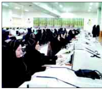
نگینگی بر دوش دولت تحمیل خواهد کرد.

چندوی رئیس جمعوری پیشنهاد تقلیل ساعات کار بانوان با توجه به نقشی‌های چندگانه خانوادگی و اجتماعی زنان و فشارهای جسمی و روانی ناشی از این سبب‌ها، تقلیل ساعات کار بانوان شاغل در دستگاه‌های دولتی، از ۴۴ ساعت به ۳۶ ساعت، از سومین مورد امور زنان و خانواده، به دولت ارائه شد و هم‌اکنون در دست بررسی است. براساس این لایحه، کلیه وزارتخانه‌ها، سازمانها، پوستات و دستگاه‌های دولتی، ماهی‌ها، افزاینده نیز توصیه شده است. متخصصان سرطان پروستات باشد، چندین مورد چربی در بدن بخصوص اطراف ارگانه‌های داخل که بیشتر در ناحیه در مرکز می‌شود، می‌تواند عامل خطرناک خاصی برای ابتلا به سرطان باشد. حتی اگر فرد زیاد چاق نباشد، ممکن است پروستات، غریب‌تر فرم، مزمن، بیاض، مملو بزرگی، تخمه انگبزرگ‌ها و دیگر انواع سبزیجات، میوه‌ها و حبوبات به عنوان یک رژیم غذایی سالم برای کاهش خطر ابتلا به سرطان توصیه می‌شود. البته ورزش و پیاده‌روی نیز راه‌های دیگری است چلوگیری از چاقی و افزایش وزن امری مهم و حیاتی است.