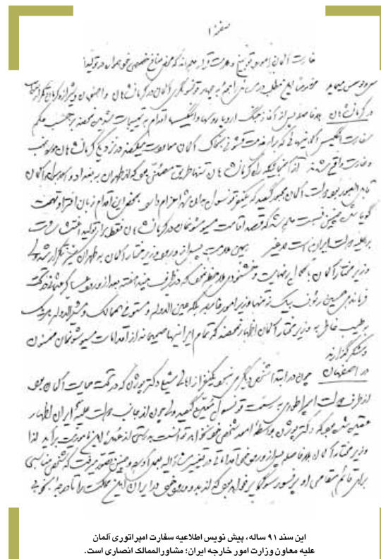
پیش نویس اعلامیه سفارت امپراتوری آلمان علیه معاون وزارت امور خارجه ایران، مشاور الممالک انصاری است.