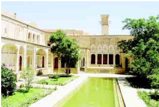
نگاهی دوباره به خانه تاریخی بروجردی ها در کاشان

بعدها مستوح شدن برخی صنایع دستی نظیر گویه دوزی و کلاه مالی در کرمان که به تغییر وضع دوستانه بازار بزرگ و قدیمی این شهر منتهی می برده است.