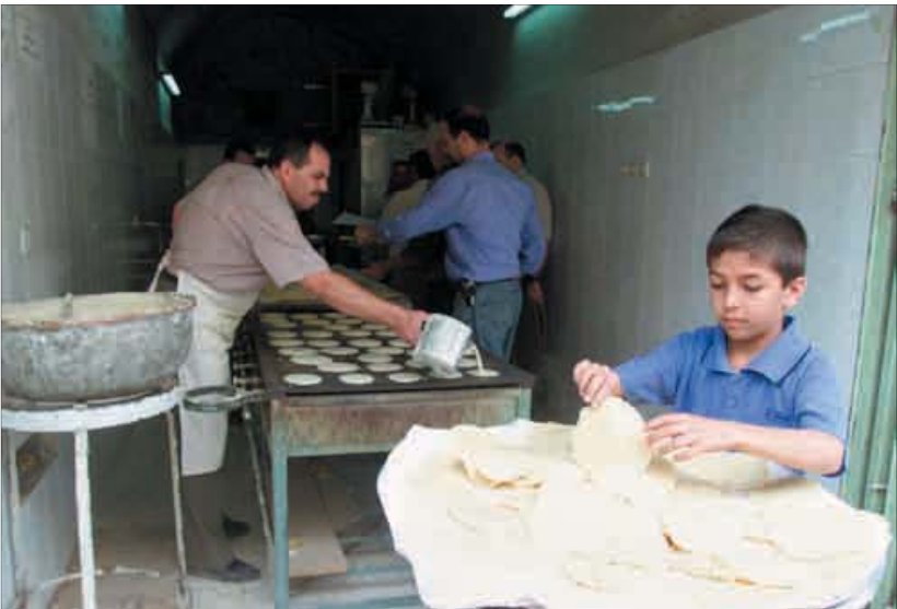
[سه‌شنبه ۲۵ تیر]

مدیر کل شرکت غله و بازرگانی استان بوشهر از صدور مجوز ساخت برای ۱۷ واحد تولید نان صنعتی در استان خبر داد که ساخت ۷ واحد آن در مرحله پیگیری و دریافت تسهیلات است.