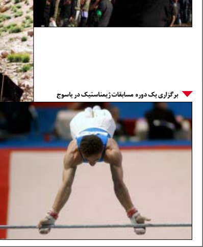
برگزاری یک دوره مسابقات ژیمناستیک در یاسوج