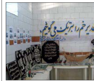
مشارکت نهادهای و ادارات استان در برگزاری عید سعید غدیر خم