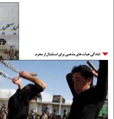
آبادگی هیأت‌های مذهبی برای استقبال از محرم