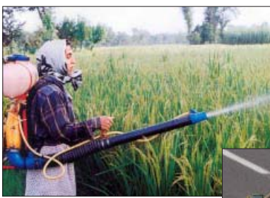
آفت زدایی از ۵ هزار هکتار اراضی استان