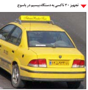
تجهیز ۳۰ تاکسی به دستگاه بیسیم در یاسوج