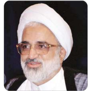
محمد علی صدوقی: حضور گسترده مردم در مراسم استقبال از رهبر معظم انقلاب یبعی مجدد و ناگسستی با ایشان است