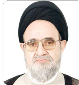
محمد تقی محصل همدانی: بیانات گهربار رهبر فرزانه انقلاب در یزد منشأ بسیاری از تصمیمات سیاسی، اقتصادی و فرهنگی در این استان خواهد بود