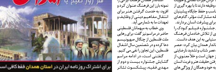
برای اشتراک روزنامه ایران در استان همدان فقط کافی است با شماره‌های ۰۲۵۴۰۴۵۴ و ۰۲۵۴۰۴۵۴ (۸۱۱) تماس بگیرید

اینها را هم می‌کند. حضور دارون کودک و نوجوان با لباس‌های رنگارنگ از دیگر جلوه‌های زیبای جشنواره بود. نورافشانی شد، ۲ بار یک‌بار در آغاز و یک‌بار در پایان مراسم. هنرمندان برجسته سینمایی ایران و میان حضور خاله‌ها شدند، شخصیت محبوب