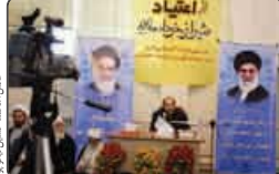
کاهش سن اکتیاد جوانان کشور را تهدید می‌کند

کاهش سن اکتیاد به ۱۶ تا ۱۴ سال و رواج استفاده از مخدرهای صنعتی جوانان ایران را تهدید و مسؤلیت ما را سنگین‌تر می‌کند.