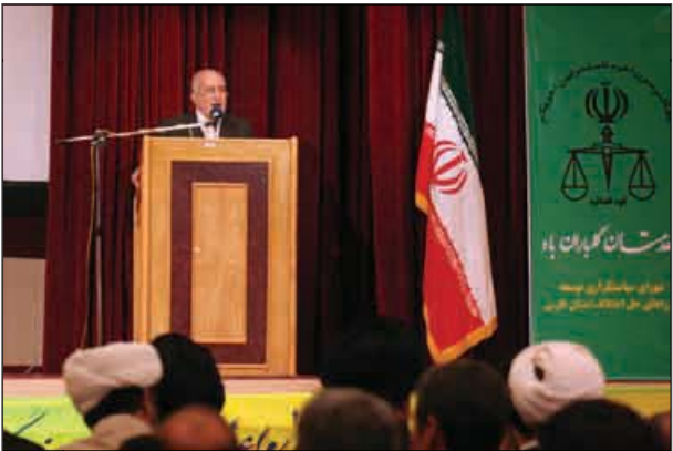
کاهش سن اکتیاد جوانان کشور را تهدید می‌کند