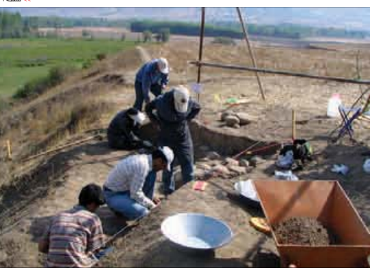
۲ صفحه <<

♦ مرحله نخست کاوش‌های باستان‌شناسی در قل خسرو یکی از قدیمی‌ترین تپه‌های باستانی جنوب کشور در یاسوج آغاز شد ♦ این مرحله از کاوش به صورت یسکانی در شبی بالای ۷۰ درصد با مشارکت ۸ کاوشگر به مدت یک ماه اجرایی می‌شود ♦ مطالعات باستان شناسان قدمت قل خسرو را تا ۳ هزار سال پیش نشان داد ولی با اجرای این طرح آشنایی با قدمت ۷ هزار سال پیش کشف شده است