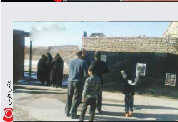
«حضور در اداران در منزل زاده‌ای آیت‌الله‌هاشمی رفسنجانی در روستای بهرام کرمان»