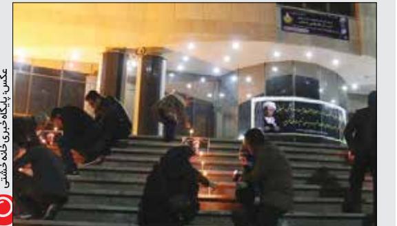
«امالی» رفسنجان به یاد آیت‌الله‌هاشمی رفسنجانی در این شهرستان شمع روشن کردند