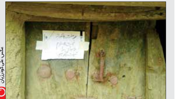
«همردی» به خاطر رحلت آیت‌الله‌هاشمی رفسنجانی در روستای «ارقعده» ملایر