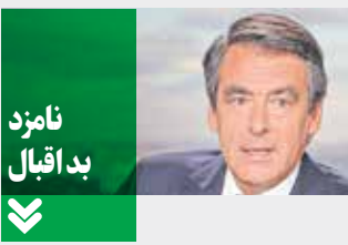
نامزد بد اقبال

ژان لوک ملانشون که او را برنی سندرز فرانسه می‌نامند، ۶۵ ساله است. او نیز ریشه در حزب سوسیالیست دارد، اما به این حزب وفادار نماند و در سال ۲۰۰۸ آن را ترک کرد و حزب «چپ» را بنیان نهاد. او تحت حمایت حزب کمونیست در انتخابات ۲۰۱۲ شرکت کرد اما شکست خورد و اکنون در انتخابات ۲۰۱۷ با حزب جدیدی که تأسیس کرده یعنی حزب «فرانسه تسلیم نشدنی» وارد رقابت‌های انتخاباتی شده است. او نیز اعتقادی بر حضور فرانسه در اتحادیه اروپا ندارد و تأکید می‌کند فرانسه باید برای پرهیز از رویاری با روسیه از ناتو خارج شود. او همچنین منتقد امریکا بویژه امریکای تحت ریاست جمهوری ترامپ است.