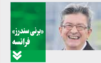
«لویی سندرز» فرانسه

ژان لوک ملانشون که او را برنی سندرز فرانسه می‌نامند، ۶۵ ساله است. او نیز ریشه در حزب سوسیالیست دارد، اما به این حزب وفادار نماند و در سال ۲۰۰۸ آن را ترک کرد و حزب «چپ» را بنیان نهاد. او تحت حمایت حزب کمونیست در انتخابات ۲۰۱۲ شرکت کرد اما شکست خورد و اکنون در انتخابات ۲۰۱۷ با حزب جدیدی که تأسیس کرده یعنی حزب «فرانسه تسلیم نشدنی» وارد رقابت‌های انتخاباتی شده است. او نیز اعتقادی بر حضور فرانسه در اتحادیه اروپا ندارد و تأکید می‌کند فرانسه باید برای پرهیز از رویاری با روسیه از ناتو خارج شود. او همچنین منتقد امریکا بویژه امریکای تحت ریاست جمهوری ترامپ است.