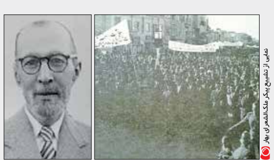
نمایش از نمایشگاه بینک ملت شعراي بهار